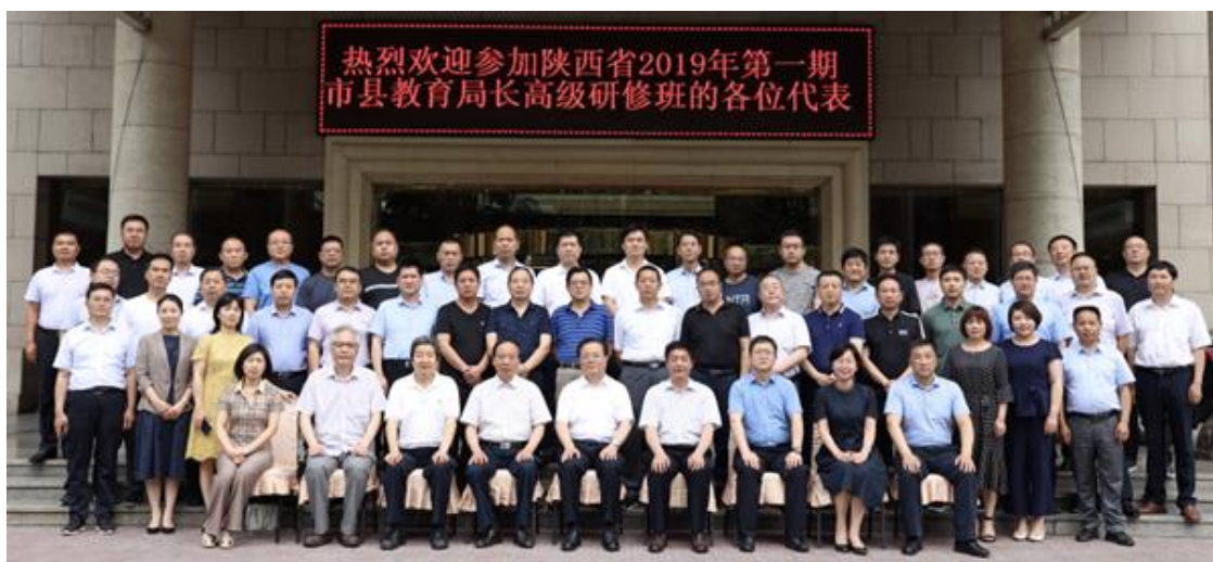
陕西省 2019 年第一期市县教育局局长高研班集体合影

本次研修班为期 12 天，共有来自全省各市（区）县的 52 位教育局局长参加学习。研修班以落实省委省政府《关于全面深化新时代教师队伍建设的实施意见》精神、推进区域教育改革发展为主题，采用“省内集中研修（西安）+省外高级研修（上海）+省内交流总结（西安）”三个阶段的复合培训模式，旨在提升市县教育局局长领导地方教师队伍建设的改革的能力，为促进区域教育事业持续发展，建设一支政治素质过硬、业务能力精湛、育人水平高超的党和人民满意的创新型教师队伍开创新局面、做出新贡献、取得新成果。