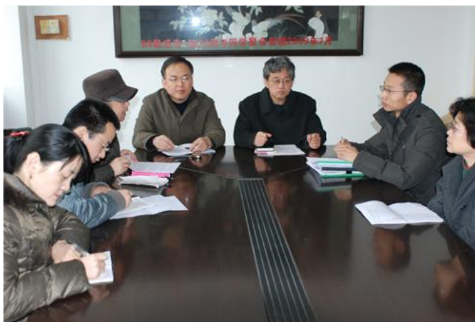
继续教育学院召集专家进行方案研讨

为了能搞好本次培训工作,西安文理学院的各级领导非常重视,教师继续教育学院作为具体承办机构,前期做了大量的调查和研究工作。教师继续教育学院两次组织幼儿教育专