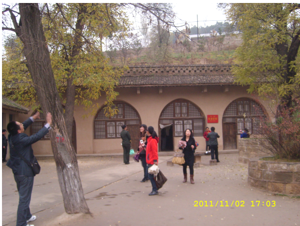
思想品德班学员在延安枣园参观考察

从延安革命纪念馆出来，学员们来到杨家岭。杨家岭是中共中央领导在1938年11月至1947年3月期间的住处。这里还曾进行过轰轰烈烈的大生产运动、整风运动。学员们参观了中共中央七大会址、延安文艺座谈会会址，以及毛泽东、朱德、周恩来，刘少奇等领导同志们当年的