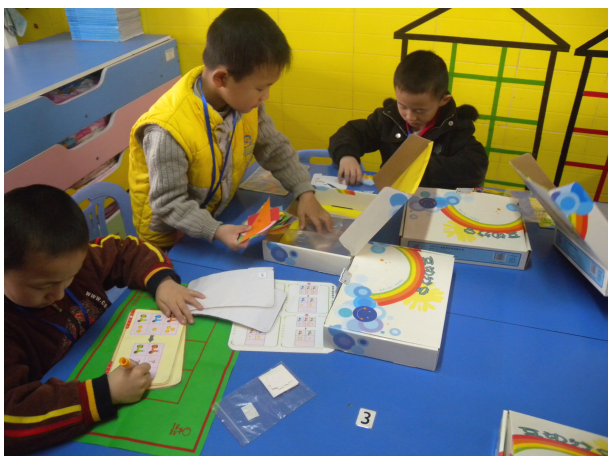
幼儿园小朋友在手工制作

走进蒙氏幼儿园的各个班级，不用介绍，我们就从环境中感受到本学期已进行的主题活动：春天来了，妈妈我爱你。只是每个班所呈现的形式不同。小班以手指点画“大树”、手工“装饰妈妈的头发”。同样是小班，装饰妈妈的头发方式也不同，有剪弧线的，有贴圆环的，有涂色的。大班以‘十二生肖’线描画“漂亮妈妈”的内容呈现着。这就是教育的痕迹。正如杨园长所说的，