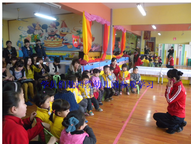
学员们赴西统幼儿园参观学习