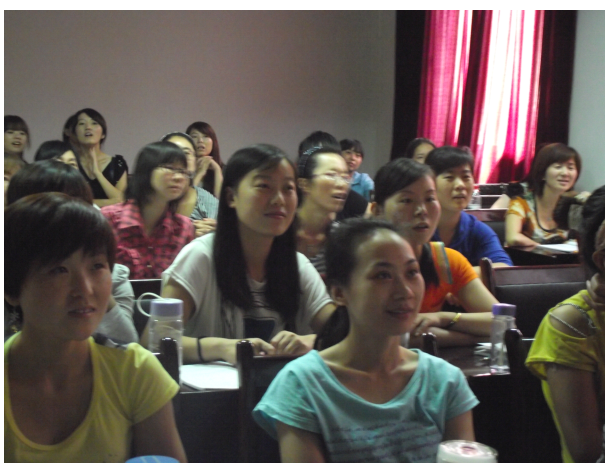
学员们在聚精会神听讲