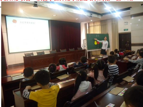
学员赴翠华路小学观摩教学