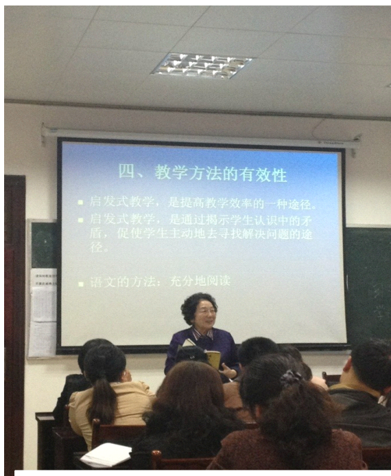
北京教育学院苏立康教授

以往片面注重结果的学习过程，对学生获取知识与技能的过程给予高度的重视与肯定。所以，关注个体差异，培养创新人才是我们教育的出发点。学生是有着丰富个性的完整的人，尤其初中生活泼好动，具有丰富的情感，活跃的思维是一群身心不断发展的青少年。我们不能用一个模式去塑造和评价学生，要看到学生之间的差异，尊重差异、善待差异。