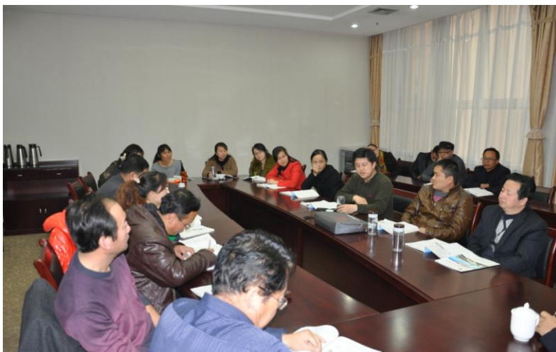
学员们进行座谈研讨活动

专家们的今日之成就不正是我们的追求？学无止境，他们之成就宛若点点繁星之中距我们最近的那个星座！他们为星辰，虽不甚灿亮，仍能引导暗夜中前行的人；虽形态迥异，仍能点缀着空寂的夜空，使天空不再孤单；他们为星辰静静的凝视着大地，提醒着人们不要懈怠；他们为星辰，那智慧的晶闪，促人无限的向往！