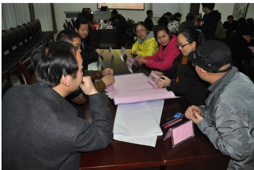
学员们进行研讨交流

候，由于专业能力不强，我就开始了追求技术或是经验的提升，想起向老教师学习，去学习他们的教学方式和教学技巧。发现别人的经验自能拿来借鉴，不能拿来为我所用。这样对学生进步也有了一定的阻碍，也妨碍了