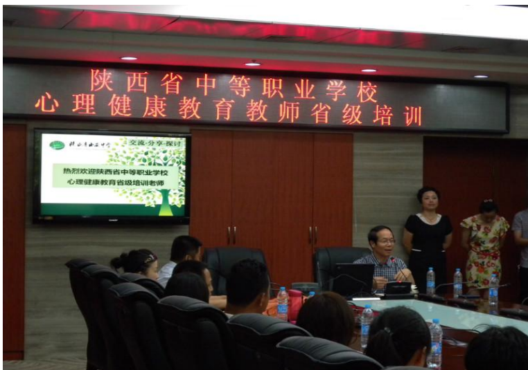
学员赴西安中学观摩学习