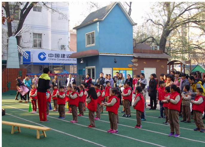
参观四医大校直幼儿园

“健康”包括两个方面的内容——身体健康和心理健康。生理的健康发育和心理的健康发展是有机结合的。3岁至6岁的幼儿处于人一生中发展的关键期，这一时期幼儿教育机构的良好教育更是至关重要的。幼儿园健康教育的目的不仅是