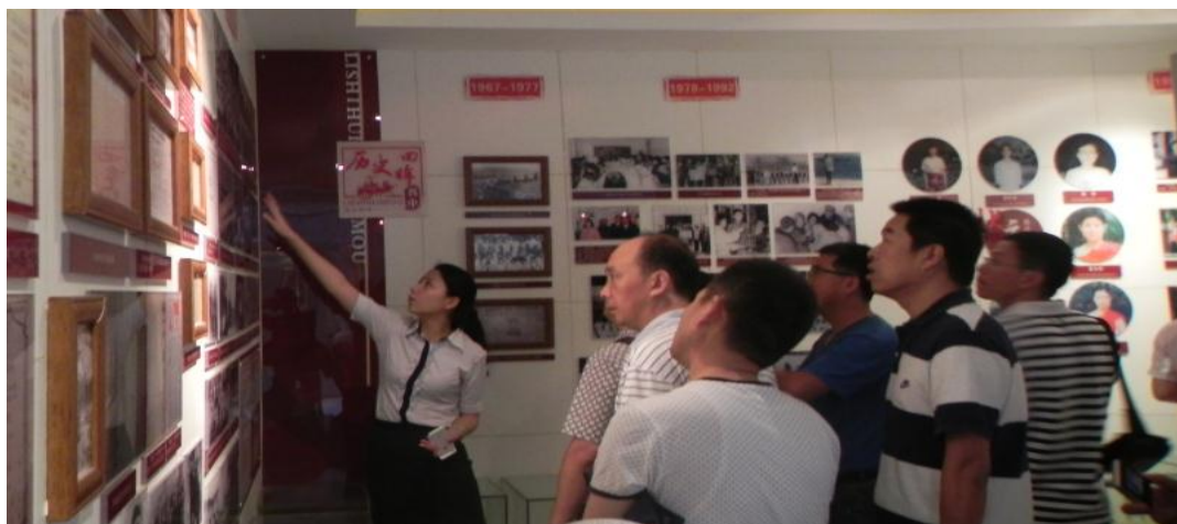
陕西国培中学校长管理能力高研班在西安中学观摩现场