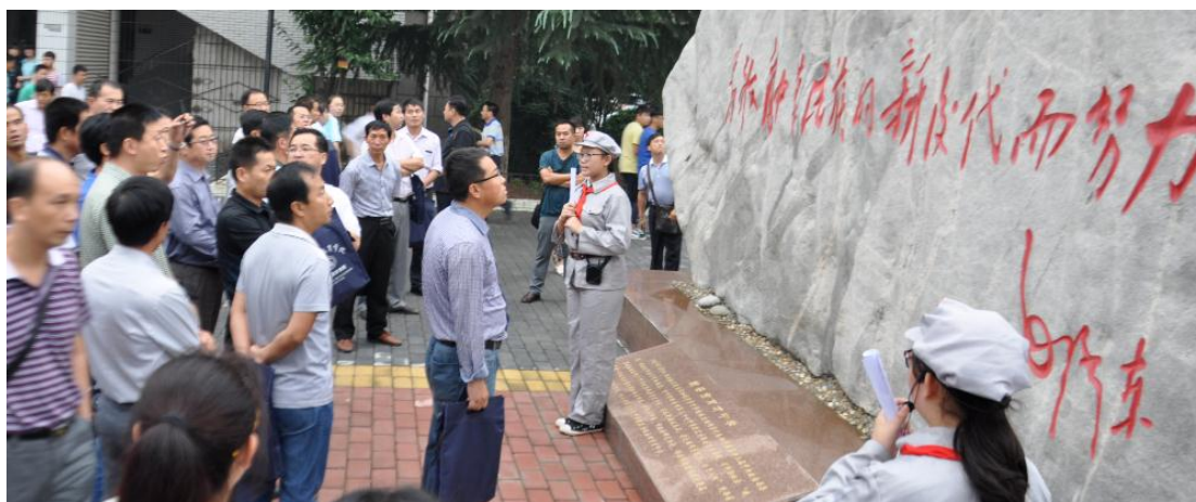
西安育才中学为国培中学校长管理能力高研班学员进行现场教学和跟岗实践