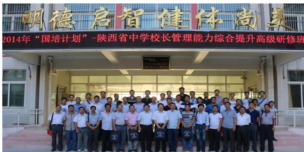
陕西国培中学校长管理能力高研班参观西安高新第二学校合影

陕西学前师范学院校园长培训部在2014“国培计划”-陕西省中学校长管理能力综合提升高级研修班的培训课程设置中，组织参训校长前往西安高新一中、西安高新第二学校、西安中学、经开中学、西安育才中学、周至中学、周至二曲中学七所富有办学特色的基地学校进行现场观摩、跟岗实践和情境体验，通过案例教学现场解决学校管理中的实际问题，进一步提高了培训的针对性和实效性。