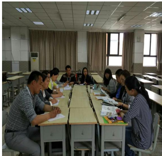
观摩教研组活动，虚心学习，静静反思，收获满满。