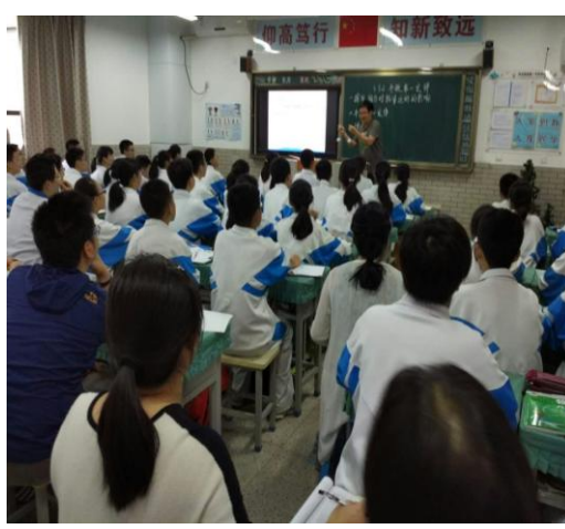
走进课堂聆听教师讲课，各教师认真学习先进的教学方法