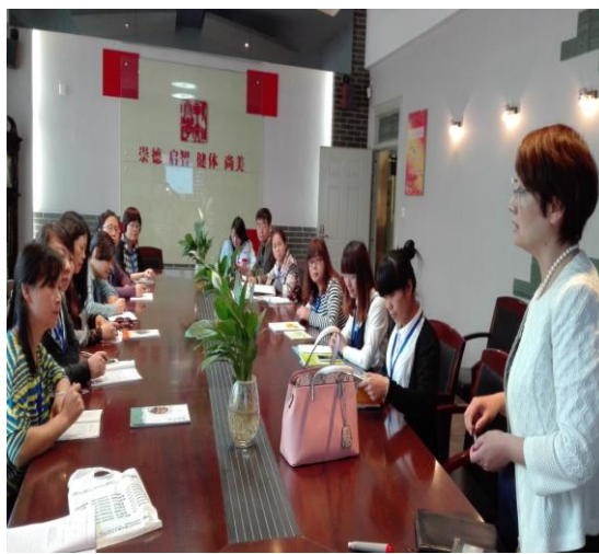
先进的教学理念，全新的管理模式让教师们耳目一新。