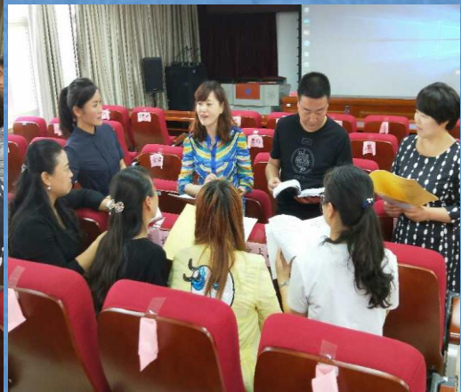
交流培训感受 分享学习收获