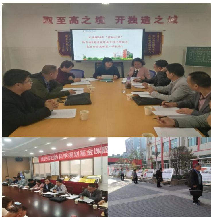
图 3：影子校长参观西安高新第二学校校园文化建设