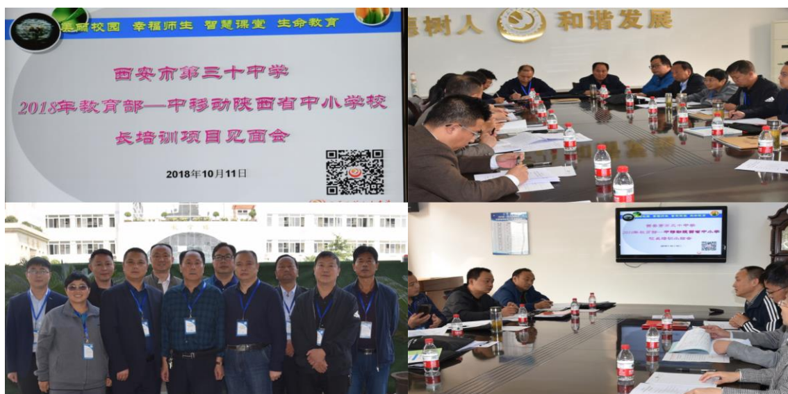
西安市第三十中学影子培训见面会、小结会