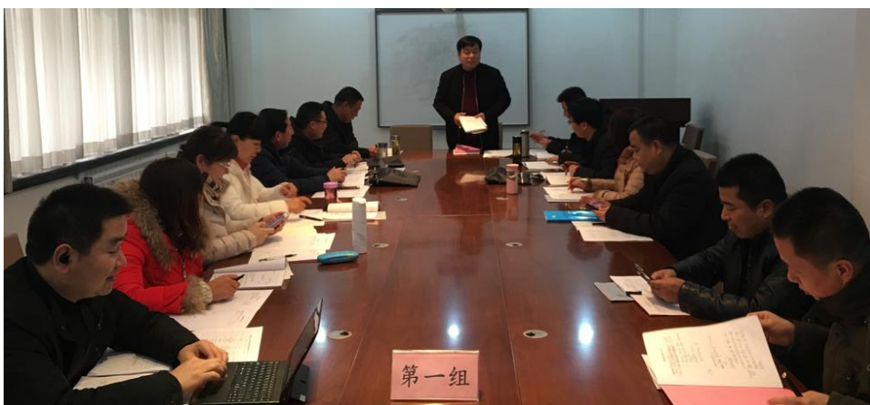
第一小组交流研讨