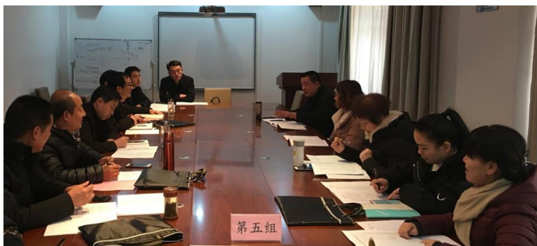
第五小组交流研讨