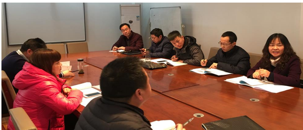
第四小组交流研讨