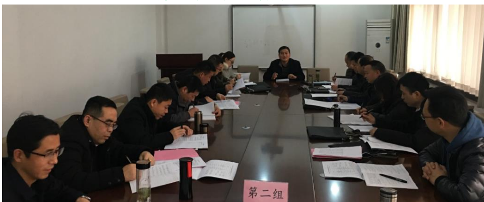
第二小组交流研讨