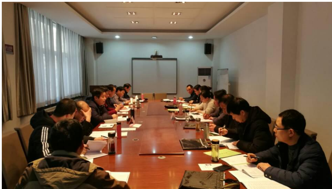
小组交流，学员点评